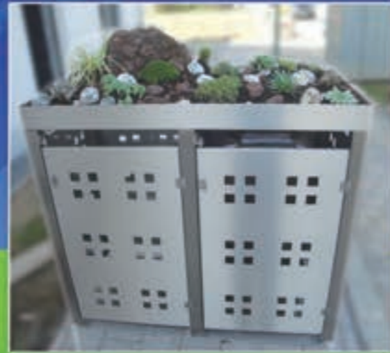
Abb.: 2fach 120L/120L