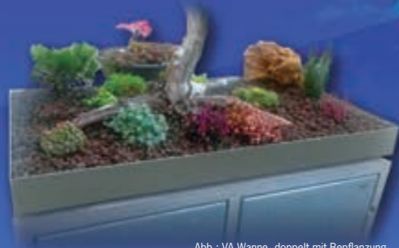
Abb.: VA Wanne, doppelt mit Bepflanzung